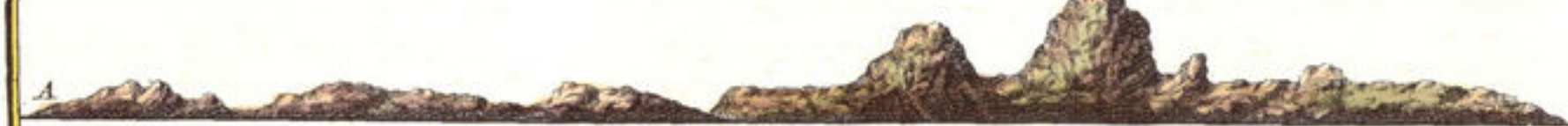
Aldus vertoont CURACAO als 't 3. Myl West van u is, en als men inde haven komt, meer men 3. Scheuten schieten A. A. behooren met 't bovenstaende Figuur aen malkanderen.